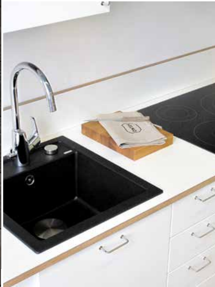
Kallio on HELNO:n suosituin keittiömallisto. Siinä, kuten muissakin yrityksen malleissa on korkeapainelaminaatilla päällystetty vaneritaso, joka on helppohoitoinen ja kulutusta kestävä. HELNO käytti vastaavaa rakennetta työtasoisissa jo 1940-luvulla.