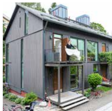
■ Talon sisätilat jatkuvat luontevasti ulkoilmaan. Parvekkeella ja sen alla olevilla puuportailta on kiva oleskella.

”Näky on superkaunis, kun kirsikkapuut kukkivat keväällä tai kun puut ovat talvella valkoisen lumen peittämiä.”