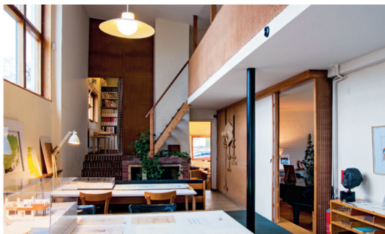
Aaltojen koti Munkkiniemen Riihitieellä.