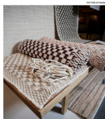
Punos-matot ovat kevyitä ja lämpimiä. Ne on valmistettu viljan-kapällysteisestä kuteesta, jonka sisällä on kevyt polyeteeninauha.